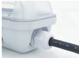
-AC電源入力線(約1m)- 富士電線工業製