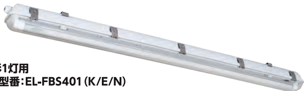
■40形1灯用 器具型番:EL-FBS401 (K/E/N)