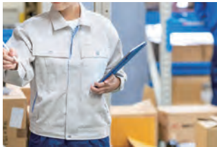
社内で全数検品 在庫を常備