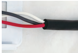
片側配線、両側配線可