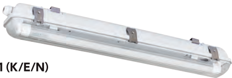
■20形1灯用 器具型番:EL-FBS201 (K/E/N)