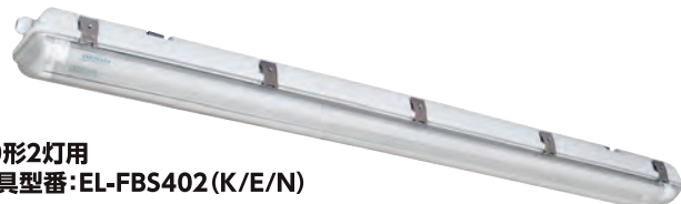
■40形2灯用 器具型番:EL-FBS402 (K/E/N)

※1. -K:弊社ランプ専用片側配線 -E:器具内配線無し -N:お客様のランプ専用配線