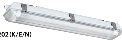
■20形2灯用 器具型番:EL-FBS202 (K/E/N)