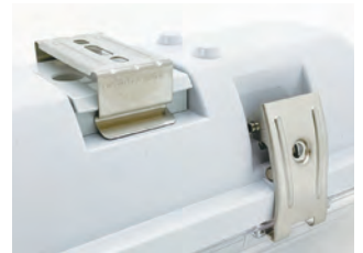
-カバー留具・取付金具- ステンレス(SUS304)